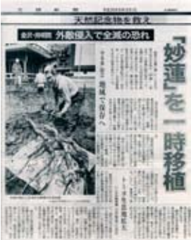
天然記念物を救え、「守る会」創立・地域で保存へ、妙蓮の一時移植、を伝える平成20年5月12日(月)の「北国新聞」